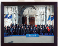
2007 Ekainak 17 Lisboako Hitzarmena sinatu zenean.

Lisboako Hitzarmenak herritartasuna bultzatzen du eta balio europarrak ezartzen, parte hartze demokratikorako bide berriak zabaltzen dituelako eta Oinarritzko Eskubideen Kartaren testua aintzat hartzen duelako.